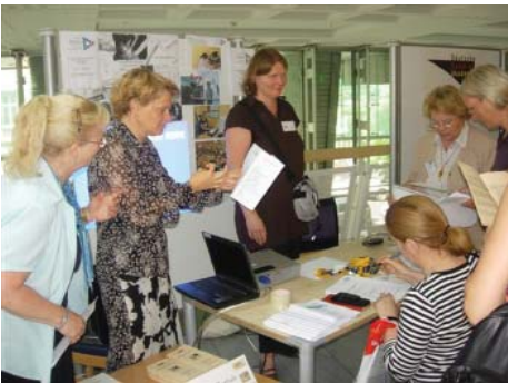
Infostand von Pfiffikus zur Schülerakademie 2008

Die Situation für hoch begabte Kinder war 2001 alles andere als erfreulich. Von zunächst 16 vom Verein betreuten Kindern befanden sich 8 Kinder in psychiatrischer Behandlung. Zu Beginn un-