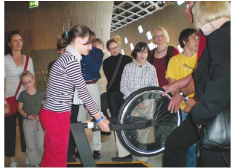
Familienausflug in die „Phaeno“ nach Wolfsburg 2009

Ein Aspekt, der bislang wenig beleuchtet wurde, ist die Rolle der Kreativität des Schülers. So selbstverständlich