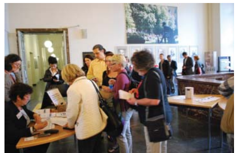
Eltern des Fördervereins in der Humboldt-Universität bei der Durchführung eines Vortrages

Autonomie und Nonkonformismus sind recht nahe liegender Weise Eigenschaften, die in der Schule nicht unproblematisch sind. Zwar wird auf die Selbständigkeit der Kinder viel Wert gelegt. Gemeint ist aber weniger die eigenständige Meinungsbildung, sondern eher die „selbständige“ Erfüllung der gestellten Aufgaben und Verhaltensanforderungen, ohne dass diese zu hinterfragen wären. Der mündige Schüler, der den Unterricht seines Lehrers kritisch hinterfragt, ist eher theo-