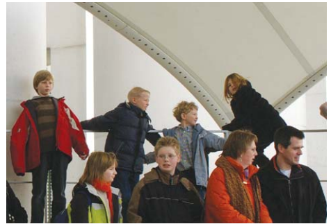
Besuch im Kanzleramt

Soziale Gerechtigkeit bei der Hochbegabtenförderung setzt notwendig die Offenheit der Bildungsgänge voraus, damit ein Kind zu jeder Zeit, zu der besondere Begabungen entdeckt werden, an die passenden Angebote herangeführt werden kann. Die durchs Raster Gefallenen, die wegen mangelnder Unterstützung im Elternhaus oder unangepassten Verhaltens in einem falschen Bildungsgang gelandet sind, müssen jeder Zeit die Chance erhalten, in den passenden Bildungsgang zu wechseln. Gesamt- oder Gemeinschaftsschulen können ein Weg sein, sofern Angebote für Hochbegabte dort eingerichtet werden. Dort, wo die Wege sich nach der Grundschule trennen, müsste ein Wechsel zwischen den Bildungsgängen zu jeder Zeit möglich bleiben. Förderprogramme für Hochbegabte müssen in den Unterrichtsmethoden und den Anforderungen noch mal deutlich angehoben werden und für Quereinsteiger offen sein. Alles andere wäre genau die Elitusbildung, die man der Hochbegabtenförderung gerne unterstellt: die Auser-