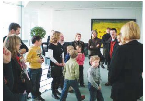
Eltern und Kinder des Fördervereins

aller Macht das Etikett Hochbegabung verschaffen wollen, um schulische Vorteile durchzusetzen, können wir allerdings nicht feststellen. Diese gibt es ohne Zweifel, aber aus unserer Sicht bleiben es Einzelfälle, zumal die positive Reaktion der Schule ja keineswegs sicher ist. Es stimmt uns daher nachdenklich, dass solche Einzelfälle mehr und mehr auch von Schulen herangezogen werden, um die alte Einstellung, es gebe doch kaum Hochbegabte, die anderen seien nur Wichtigtuer oder das Produkt ehrgeiziger Eltern, wieder bedenkenloser vorzubringen. Das Pendel schwingt zurück.