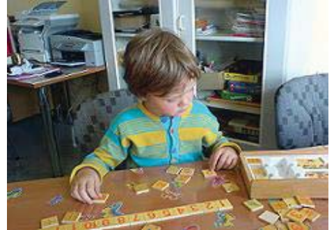
Beratung im Förderverein

gabung und Mut zu Neuerungen, so sollte uns das zu denken geben.