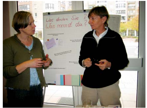
Eltern in Diskussionsrunden

Tatsächlich fragen wir uns manchmal, ob der Nachweis der vielen „sympathischen“ Hochbegabten nicht mehr geschadet als genützt hat. Die Rolle des Sonderlings gewährte deutlich mehr Freiheiten. Die intellektuellen Vorlieben vieler Hochbegabter sind aus der Sicht ihrer Mitschüler und Lehrer eben einfach nicht normal, daran ändern auch Persönlichkeitstests, die den meisten Hochbegabten eine stabile Persönlichkeit bescheinigen, nichts. Jetzt ist auch jeder Hochbegabte gezwungen, sich „normal“ zu benehmen, was immer das bedeuten mag, weil er ansonsten Gefahr läuft, von dem seinen kognitiven Fähigkeiten angemessenen Bildungsangebot ausgeschlossen zu werden, weil ihm die nötige soziale Kompetenz abgesprochen wird, die es zunächst zu erlernen gilt. Die Anforderung „erst machst Du die leichte Aufgabe, dann hilfst Du Deinem Nachbarn und erst dann darfst Du was Schwereres machen“ hat damit eine ganz neue Aktualität. „When you run onto something interesting, drop everything else and study it“, lautet demgegenüber eine wesentliche Prämisse genialer Leistung, wenn man etwa B. F. Skinner glauben möchte 51 . Dafür ist allerdings in unseren Schulen, die noch ganz überwiegend nach dem 45-Minutentakt funktionieren, nach wie vor nur sehr, sehr selten Platz. Vielmehr gilt es in der Praxis 52 immer