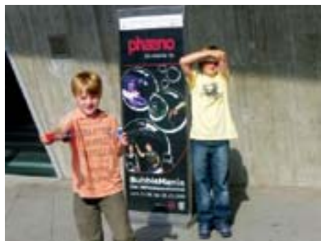
Interessierte Kinder bei der Phaeno

brauchen ein anderes Anspruchsniveau. Man braucht daher nicht nur Konzepte für den Unterricht von Hochbegabten, sondern auch das entsprechende pädagogische Personal, wie es dieses für Lernbehinderte ja auch ganz selbstverständlich gibt. Die Auswahl der Pädagogen sowie die Aus- und Fortbildung im Hinblick auf die Förderung von Hochbegabung ist also ein entscheidender Faktor.