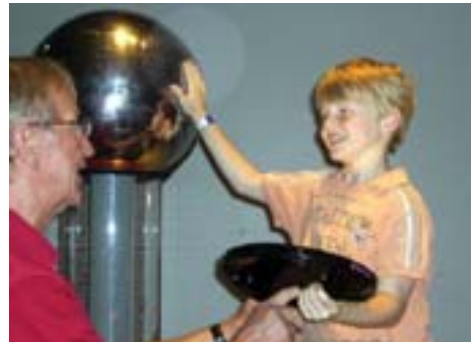
Freude und Spaß haben die Kinder beim Entdecken physikalischer Prozesse

schafft hat oder von seinen Eltern oder der Grundschule auf das Angebot nicht hingewiesen wurde, bekommt also später noch eine Chance. Diese Möglichkeit scheint sich positiv auszuwirken. Auch wird innerhalb der Klassen durchaus noch einmal differenziert, falls sich besondere Begabungs- und Interessenschwerpunkte zeigen, weil nicht nur diverse betreute Wettbewerbsteilnahmen angeboten werden, sondern den Schülern auch angemessener Freiraum gewährt wird, um eigenen Forschungsinteressen nachzugehen.