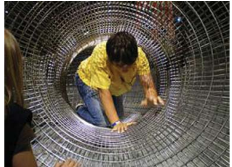
Kinder ergürnden gerne unbekannte Sphären

Dies alles sind aus unserer Sicht mass-iv problematische Situationen. Selbst wenn solche Kinder am Ende ein „ordentliches“ Abitur im Bereich zwischen 1 und 2,5 machen, so heißt das nicht, dass sie ihre Potenziale entfalten konnten. Es heißt außerdem natürlich nicht,