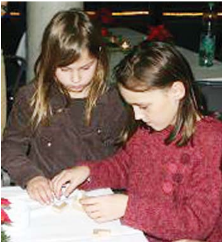
Kinder beim Knobeln

Das Ziel lautet: Begabtenförderung muss in der Schule selbstverständlich sein und Lernziele, Lerninhalte und Lernorganisation sollten auch auf die Begabungsförderung ausgerichtet sein. Die Zeit, als hoch begabte Kinder in die Psychiatrie kamen oder die Schule vor lauter Frust vorzeitig abbrechen, muss endgültig überwunden sein.